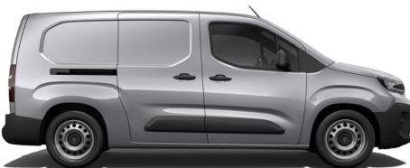
بارتنر طويل (L2)