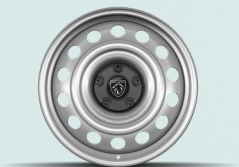
16-inch steel wheels with black half hubcap