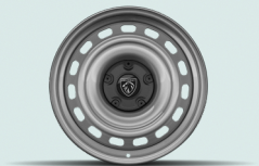
15-inch steel wheels with black half hubcap