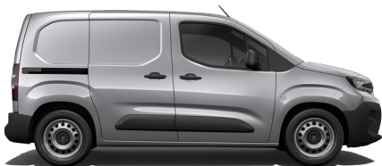
بارتنر قصير (L1)