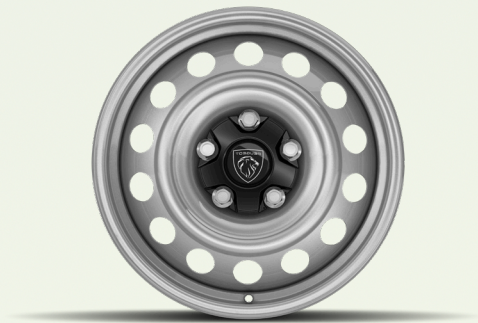
عجلات فولاذية 16 إنش مع غطاء أسود لمحور العجلة