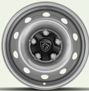
عجلات فولاذية 15 إنش مع غطاء أسود لمحور العجلة